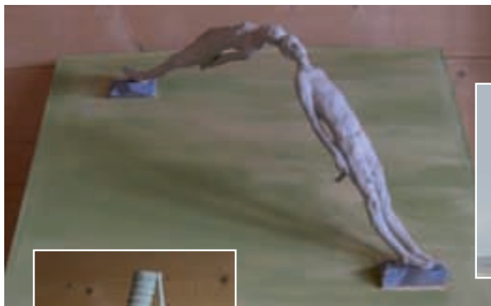
La scultura “Die Brücke” de Hubert Mussner unirà metuda su tl ridl “Costa”

Danter i modiei mandei ite à drët plajù l’idea “Die Brücke” de Hubert Mussner che à rapresentà n puent danter ël y