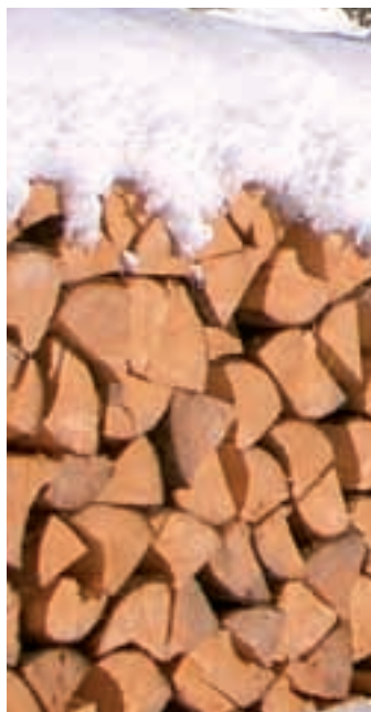
E' stato venduto legname tagliato nei boschi comunali.

E' stato avviato l'esproprio del terreno occorso per la costruzione del marciapiede lungo la SS 242 davanti al Hotel Complotj .