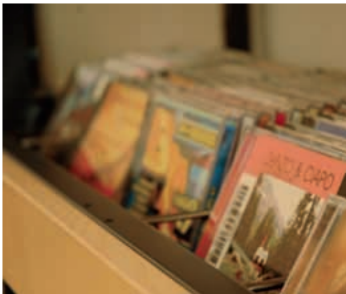
Te bibliothec iel nce d'uni sort de CDs da scuté su y nce da mpresté ora.

Duc ie de cuer nviei a unì a ticialé a chësta zaites y revistes y a se mpresté ora dut chël