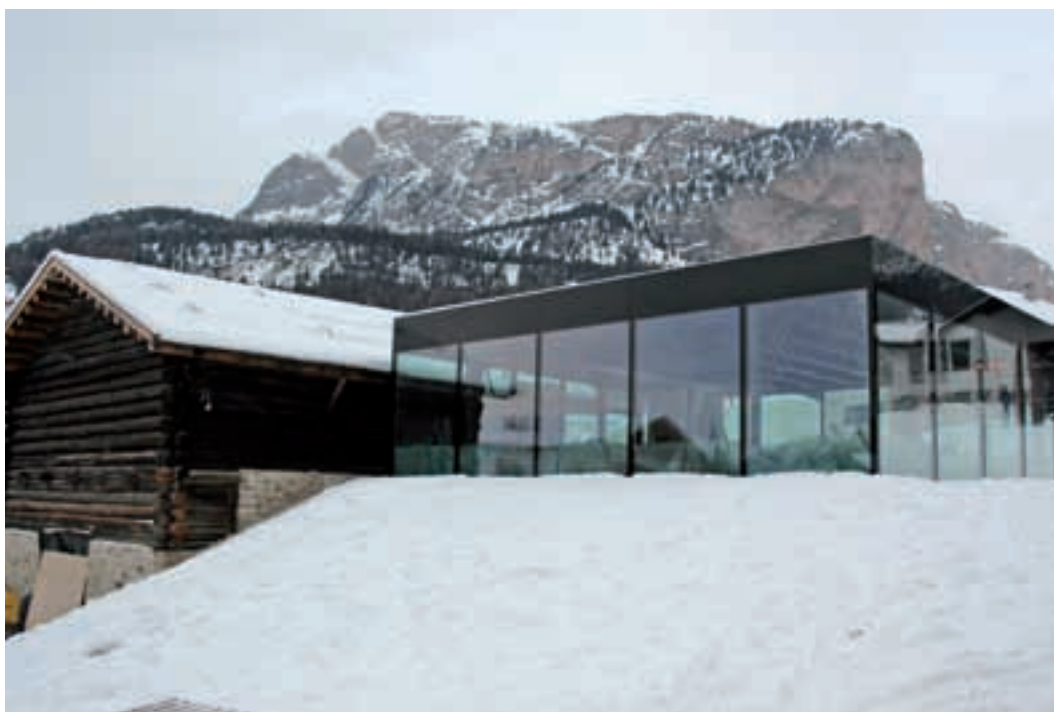
Per il centro culturale "Tublà da Nives" sono stati appaltati alcuni lavori.

E' stata approvata un'integrazione al programma dei lavori in economia per l'anno 2009 al fine di ultimare i lavori di manutenzione lungo strade e presso infrastrutture comunali.