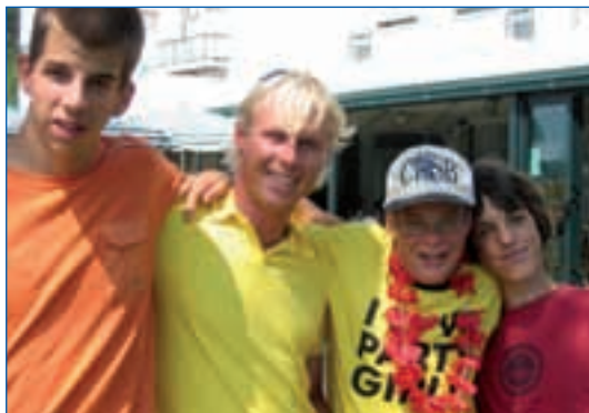
Die Lebenshilfe möchte in Gröden einen Freizeitclub aufbauen

In Gröden möchte die Lebenshilfe in Zusammenarbeit mit dem Sozialsprengel Gröden und dem Verein "Sustëni ala Vita" einen Freizeitclub aufbauen , wie es bereits in mehreren Orten Südtirols gibt.