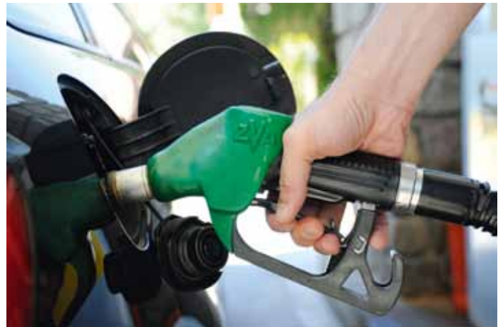
Te Sëlva puderan tosc inò ji a penzin

La pumpa nueva dal penzin, nce sce pitla, unirà realiseda avisa tla luegia ulache l ie al mumënt l gran “Schiadëur” de inox (dedora dal Fever). La figura dl “Schiadëur” unirà spustedanzaul d’auter.