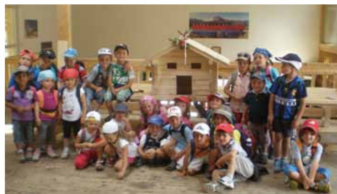
Während der "Berufeweche" wurde eine Zimmerei besucht

in das Leben eines Bauern einfühlen, indem sie selbst auf einem Bauernhof Butter herstellten, selbst Brot backten und mit zahlreichen Tieren in Kontakt kamen. Den Naturpark Puez - Geisler besuchten die Kinder in der „Naturwoche“. Während dieser Woche wurde den Kindern die Natur und dessen Vielfalt näher gebracht. Es wurden verschie-