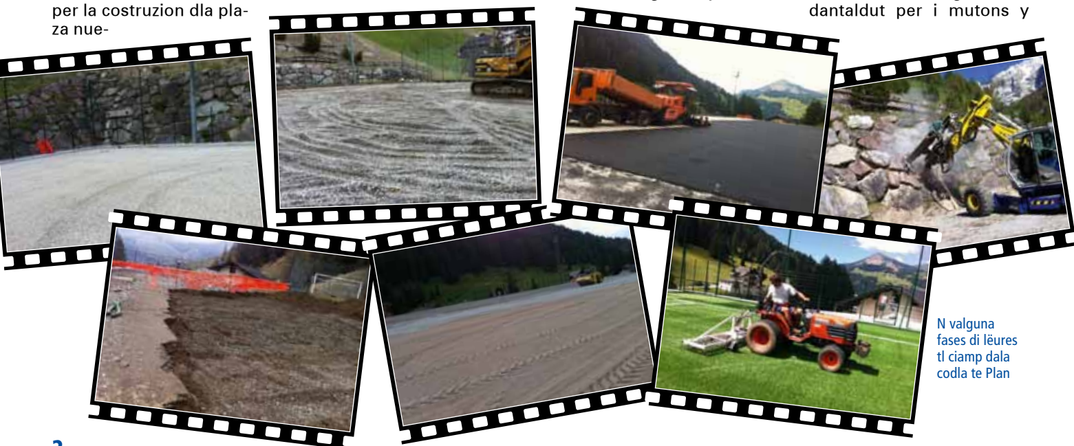
N valguna fases di lëures tl ciamp dala codla te Plan

ressei possa jì sun la plata www.polytan.de a liejer do nformazions plu avisa. Sëuravia iel pona mo unì jetà sablon de quarz, metù la ierba sintetica (furnidëur ie la Limontasports) y ala fin l granulat de gumi. Chisc lëures ie unìc fac via per l'ansciuda y ntan i prim mënc dl instà. Sun l ciamp de 93x46 metri iel pona unì dessenià ite doi sort de risses. La risses blances ie per l juech al palé tlassich, la risses ghieles ie dantal dut per i mutons y