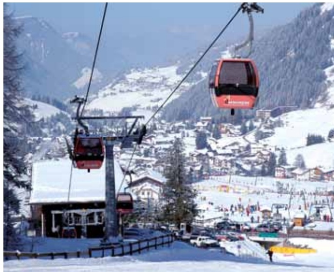
La cabinovia Dantercëpies verrà rinnovata nell'anno prossimo.