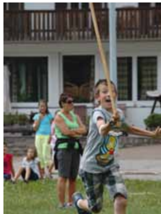
Nia saurì ne fovel a balanzé l fust...

Danora à sn. Pire zelebrà na pitla funzion jan ite sun la mpurtanza di ministronc. Avisa 80 ministronc se ova lascià scri ite y nscila iel uni fat 8 scudades, uni una ova n si culëur y l se tratova de fé deplu disciplines. Ala fin univa cumpedei adum i ponc. N iede messoven tré n undescmetri te na porta che muserova 1 meter de larghëza y ulache l mèu-