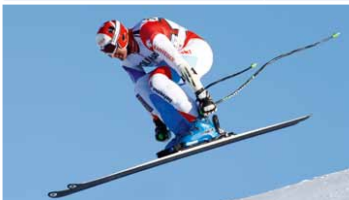
Für das bekannte Weltcuprennen in Gröden steuert die Gemeinde Wolkenstein einen Beitrag von 69.000 Euro zu.