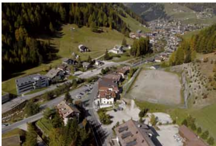
Nscila se presentova mo da n valgun ani l ciamp dala codla te Plan...

Te ciamp possa mé jì ite chiche ie registrei