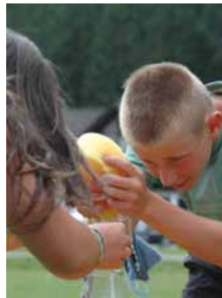
L jueuch dla sponga

ne Othmar cialova avisa sce l jiva bën dut do regula. Sambën che i ministronc che ie jugadëures dl jueuch al palé ova tlo saurì fé. Dadedò fovel da sauté cun i piesc ciulei adum, pona fovel da fé l slalom sun una na giama y tré cun l dado