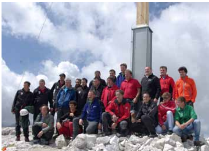
I uemes che à metù su la crèusc y l Crist sun Piz Miara

n particulér la grupa “Jèuni de Sëlva” che ova l ann passà bel rìesc tèt tla man chèsc gran lèur y che se à dat ju cun chèsc. Do la rujenedes pudova duta la jènt se maiè y bever zeche y ova nce ucacion de jì a ti cialé ala mostra de fotografies y articuli sun l vedl Crist; n à cumpedà bèn 1.200 persones. Ntan la festa iel nce unì dat ora n pitl cudejel cun duta la storia y fotografies dl vedl Crist de Piz Miara che à scialdi plajù.