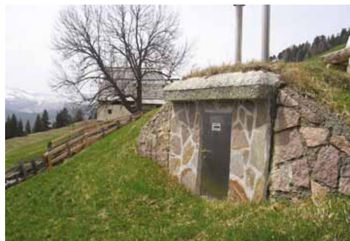
Il Comune intende realizzare una microcentrale elettrica da collocare presso il serbatoio di decompressione in località "Ciablon".

Dopo una prima gara deserta sono stati venduti mediante procedura negoziata i lotti residui del legname allestito nei boschi comunali .