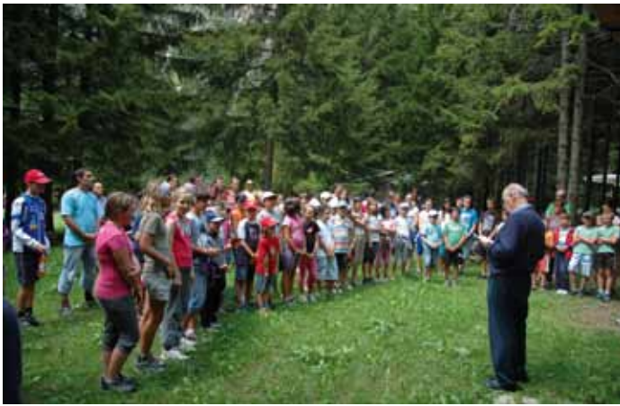
Seniëur pluan Pire Clara à tenì al scumenciamënt na pitla funzion