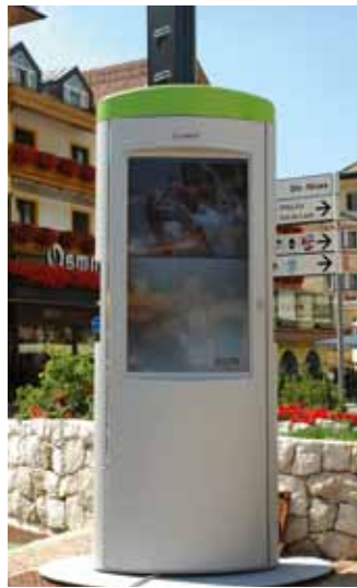
Die E-Zapfsäule am Nivesplatz.

Die Elektrifizierung des Antriebes ist ein wichtiger Teil für eine zukunftsfähige Mobilität. Auch wenn die bisherigen Antriebsarten weiterhin eine zentrale Rolle für den Verkehr darstellen, so müssen doch heute schon die Weichen für eine innovative Zukunft und der schrittweise Übergang in neue Technologien, gestellt werden. Kurz gesagt, nach über 100 Jahren in der Entwicklung des Verbrennungsmotors, zeichnet sich ein technologischer Wechsel ab.