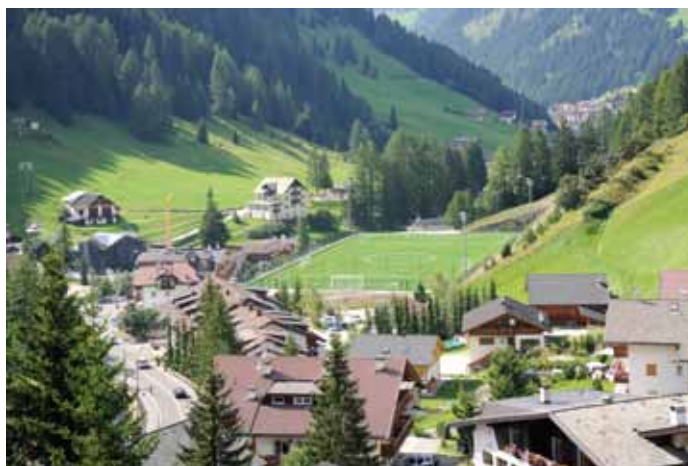
... y dut n'otra paruda fejel sën.