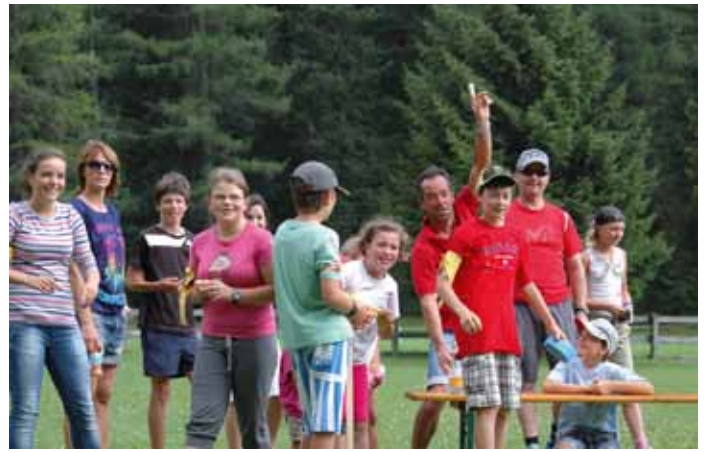
Mutons, mutans y genitores se à deverti te Val pra i jueusc olimpics di ministronc.