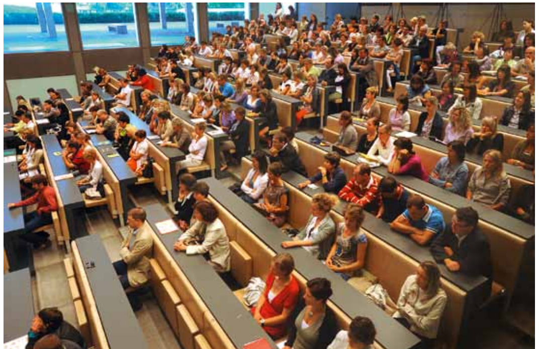
Nseniànc ladins; danterite y danterora vëijen nce maestri y maestres de Sëlva

Sesanta nseniànc ladins à pudù piè do ultimamënter na stiera de suplënza anue-la te na scola ladina. Tla Ntendënza Ladina a Bulsan iel unì sëurandat la suplën-zes anueles per nseniè tla scoles elementeres, me-sanes y autes. Chësta stie-res per dut l ann de scola à pudù piè do chiche à l'abi-litazion y che ie tla gradua-