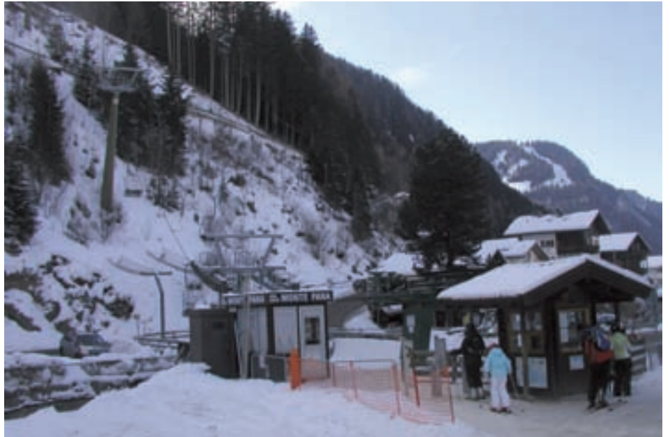
L lift de Pana unirà spustà plu inite

fé damat, tla butëighes che vënd roba da maiè y te chëla butëighes y ustaries che ne l lascia nia pro.