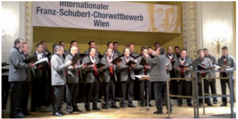
Na bela sodisfazion se à tèut I Cor Sasslong a Viena

L Cor Sasslong a fat pea tla categoria B y iló pra bèn doi cuncorsc, un per la mujiga profana y un per la mujiga sacrela. Pra I cuncors de mujiga sacrela à I cor Sasslong arjont I diplom d'arjènt (19,06 ponc) y pra I cuncors de mujiga profana à arjont gor I diplom d'or vencian te si categoria (21,36 ponc). Y chèsch fova