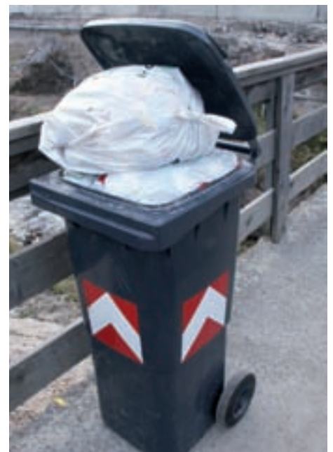
I bidoni sovraccaricati non verranno più ritirati

• L'immondizia depositata esternamente al di fuori dei bidoni non verrà asportata. Questo vale anche per l'immondizia abbandonata vicino alle campane dei rifiuti riciclabili. In ogni caso verranno esperite le necessarie indagini al fine di risalire ai responsabili.