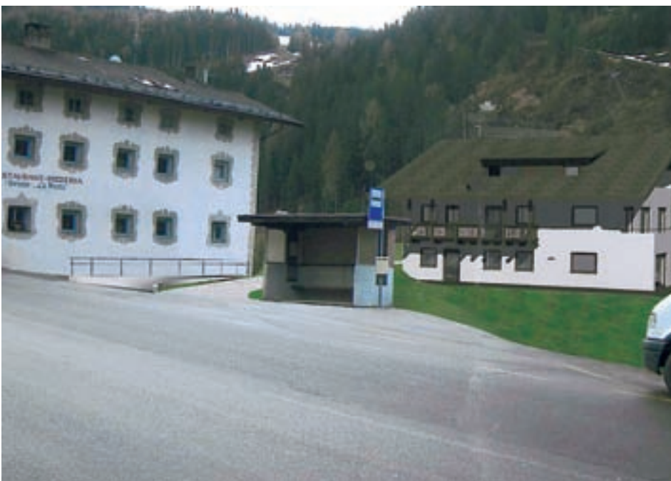
La streda per ruvé permez al raion Calonia pierà da tio demez

I destudafuech à trat i conc sot al ann 2009. De ndut à i destudafuech abù nre-des de 78.486,57 Euro y spëises de