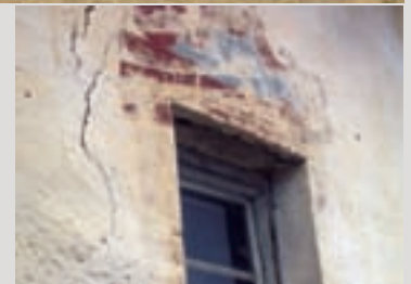
Fragmente von Bemalungen am Fenster