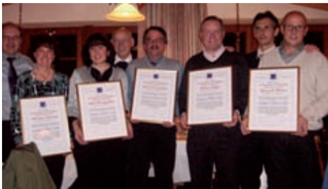
I unerei per i 40 ani de atività

La senteda ie fineda via cun na bona cèina.