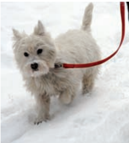
Chëi che va a spaz cun si cian muessa l tenì pra na corda

I cians ne daussa nia jì ite te curtina, ti parcs dla scola y dla scolina, ti parcs da