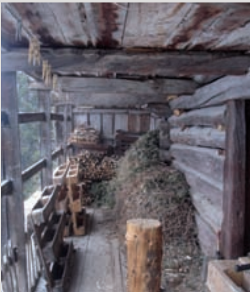
Das vorkragende Trockengestänge

Das Gebäude selbst zeigt sich in der seltenen Form eines „Einhofes“, bei dem Wohn- und Wirtschaftsräume unter einem Dach vereint, jedoch durch den First getrennt sind. Der Hof steht senkrecht zum Hang und ist mit seiner Hauptfassade nach Süden gerichtet. In seiner Bauform, Proportion und Anwendung der Materialien wirkt das Haus sehr ausgewogen. Das aus Rundholz-Blockwänden bestehende Futterhaus nimmt einen etwa gleich großen Teil des Gebäudes und der Fassade ein wie das gemauerte Feuerhaus. Dieses besteht aus vier Geschossen: dem Keller, darüber der Küche und Stube, den Schlafkammern im 2. Stock und als Abschluss dem Dachboden. Stall und Stadel sind im Wirtschaftsgebäude durch Stockwerke klar getrennt. Auch hier findet man wie bei so vielen Grödnern Bauernhäusern das vorkragende Trockengestänge. Ursprünglich war das Haus sehr viel kleiner und wurde erst im Laufe der Zeit, durch eine Aufstockung eines weiteren Geschosses und einem talseitigen Vorbau des Wirtschaftsgebäudes, vergrößert. Weitere Veränderungen waren die Abtragung des an der Ostseite gelegenen Backofens sowie kleinere Umbauten und Sanierungen im Wohnraum.