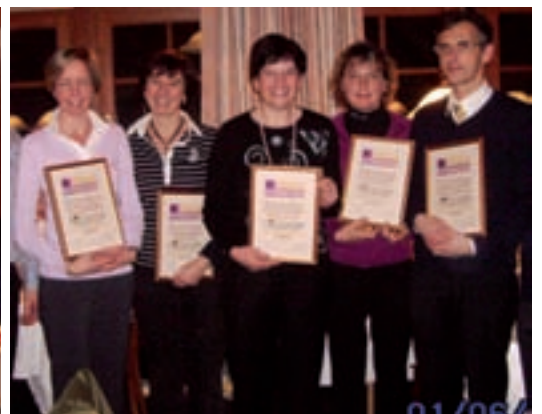
Uneranza per 30 ani de atività