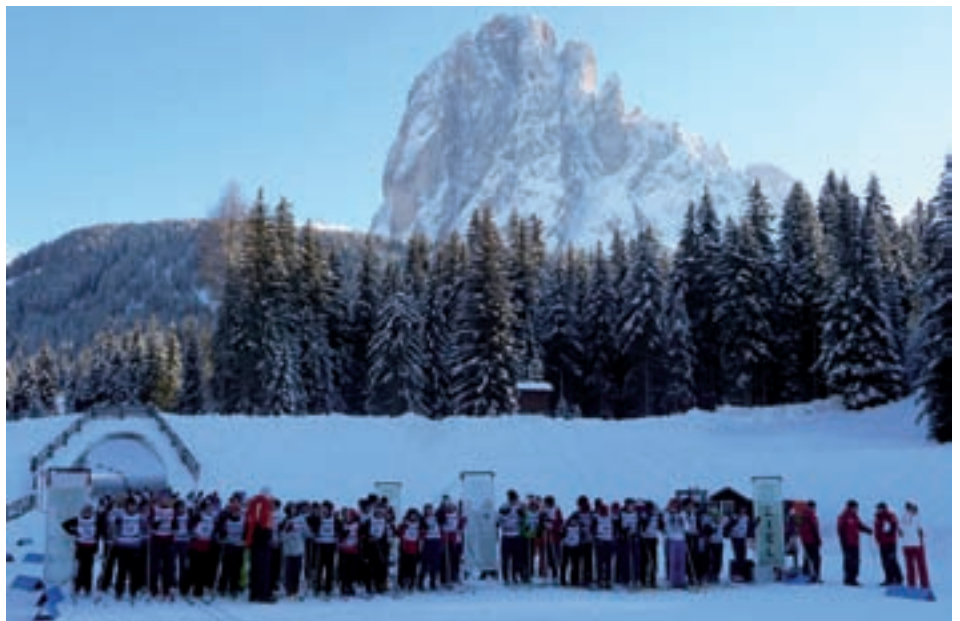
N bel tlap de sculeies aspieta sun I scumenciamènt dla garejeda

N juebia ai 14 de jené 2010 ie stata la garejeda de pudejé dla scoles mesanes y autes tl zènter de pudejé sun Pana. Tan de sculeies sciche chèst ann ne n iel mo mei stat. Plu de 200 sculeies à fat pea pra la garejeda. Èi fova sparti su te deplu categories: mutans, mutons, schiclub y nia schiclub. L Schiclub Gherdëina ti à njenià ca n bel purtoi coche n possa udèi ènghe sun la foto. L prof. Walter Thaler deberieda cun la maestres de ginastica à cialà che dut vede a puntin. I diretèures y nosc ambolt se à ènghe tèut dlaurela de unì a fe I "tifo". Duc chèi che à fat pea à do la garejeda giapà n bon crafon che la Cassa Raiffeisen ti à scincà y leprò fovel mo n bon got de te.