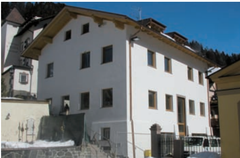
Ab 8. Mai zieht Leben in die neue Bibliothek ein

Derzeit laufen noch die Arbeiten im Inneren des neuen Gebäudes auf Hochtouren. In den nächsten Wochen werden die Böden verlegt und die Inneneinrichtung geliefert. Dann steht nur noch der Umzug der Bibliothek von der ehemaligen Mittelschule in die neuen Räumlichkeiten auf dem Kirchplatz auf dem Programm.