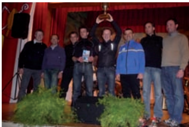
I cunselieres de S.Crestina fova i plu asvelt sun i schi

Ai 16 y ai 17 de jené ie states a Mittenwald, dlongia Garmisch, la garejedes de pudejé y de slalom lerch di aministradëures di chemuns de Südtirol, Nordtirol, Osttirol y dl Bayern. Bel chisc ani passei se ova nosc chemun batù drët bën. Chëst ann iel stat l chemun plu asvelt de duc tl slalom lerch y à nscila pudù purtè a cësa l trofeo che resterà sën per n ann ala longia a S. Crestina. L vën garejà a scuadras. Pra uni scuadra pò fe pea da trëi a