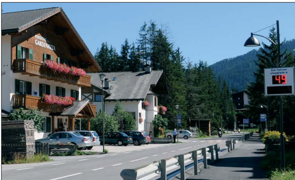
Söl toch de strada che passa Damez èl gnü metü sö n aparat da mosoré la velocitè por ti tò le sbunf ai auti y ai motors.

Chi che n'é nia en regola mesarà fà cunt cun sanzions penales y aministratives. Porchèl vègnel inviè i proprietars de fabricac che n'é nia apost cun le paiamènt di contribuèc d'urbanisaziun y di cosc de costruziun a se mète en regola pornanche ara va!