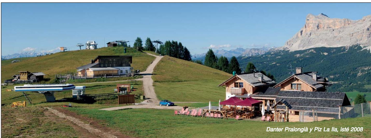
Danter Pralongià y Piz La Ila, isté 2008

La chestiun sc'al é demassa o massa püces üties da munt tl Comun de Badia é bele gnüda fora l'ann passè, canch'al é gnü presentè te Comun na domanda por podèi fà sò na ütia nòia daimprò dala Brancia sön Piz La Ila. La discussiun é stada plütosc via: al ne ti è ciàmò mai gnü dit de no a degügn y porchèl n'èl gnanca na gauja por ti dì de no a zacai che é forsc n pü' tardis da fà la domanda. Impò nen n'èl de chi che se temò dala concorènza y chësc é gnü fora tler tla discussiun.