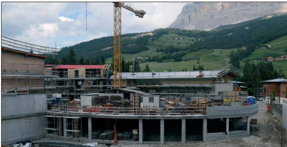
La pert ia dô la sênta dla Crusc Blanca destinada a botêghes y tan che dÛc i garage sarà de proprietè privata.

tla zona d'espansiun San Iaco a San Linert, un le plann de segurèza, la contabilitè y la direziun di laùrs por n import de 14.917,74+2% + 20% CVA. Al é gnü aprovè la spèisa de 8.511,30 Euro (CVA laprò) por cumprè na baraca dal cartun da mète tla plaza dlungia le ciamp dal sport a La Ila.