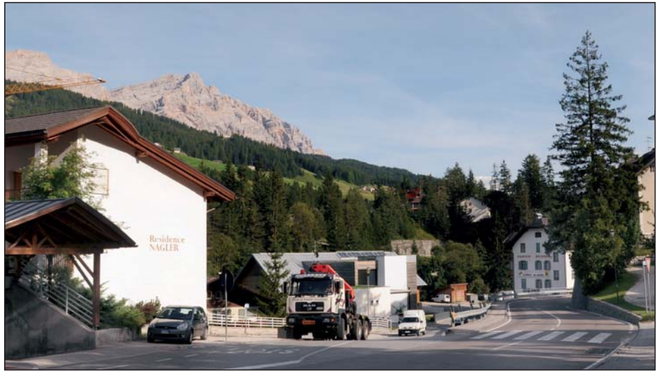
Incrujada olach'al messass gnì realisé na torona a Pedracces.

Intratan vègnel incè baié d'urgènza de ciafè na soluziun al trafich tl zènter da La Ila, olache al se formèia tres indò codes y codes tratan la sajun alta, dantadòt d'invern. Dan da zacotan d'agn s'à le Comun jomè ia la poscibilité de fà na strada de zirconvaziun a La Ila che è, aladò dl PUC, preodüda a pé de Boscdaplan ite y